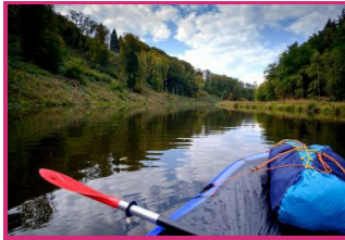
WBT - Beno Stoen