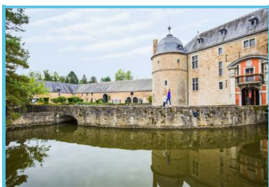
WBT - Denis Erroyaux