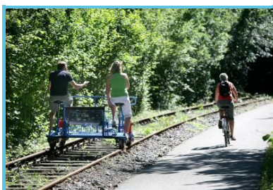
FT Province de Namur